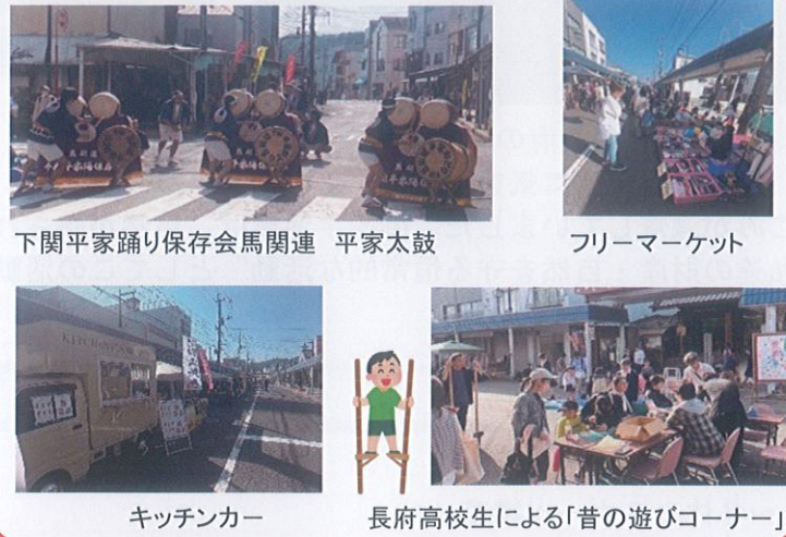
下関平家踊り保存会馬関連 平家太鼓 キッチンカー フリーマーケット 長府高校生による「昔の遊びコーナー」