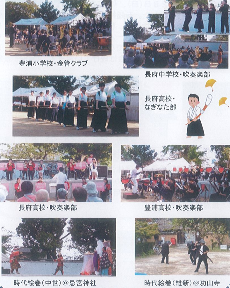
豊浦小学校・金管クラブ 長府中学校・吹奏楽部 長府高校・なぎなた部 時代絵巻(中世)@忌宮神社 時代絵巻(維新)@功山寺