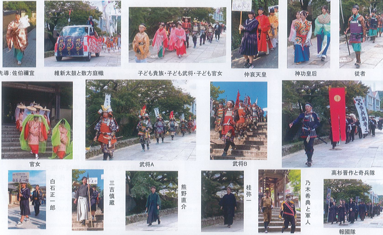
先導: 佐伯彌宜 維新太鼓と数方庭幟 子ども貴族・子ども武将・子ども官女 仲哀天皇 神功皇后 従者 官女 武将A 武将B 高杉晋作と奇兵隊 白石正一郎 三吉慎蔵 熊野直介 桂弥一 乃木希典と軍人 報國隊